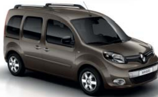
Castanho Moka (TE CNB)

* Apenas disponível com para-choques em preto OV: Pintura opaca; TE: Pintura metalizada Imagens não contratuais.