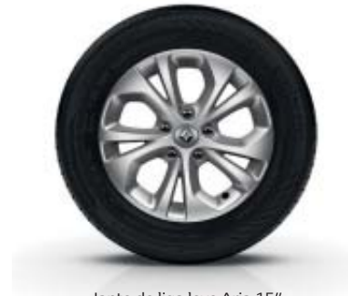
Jante de liga leve Aria 15"