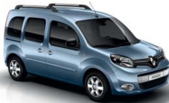
Azul Estrela (TE RNL)