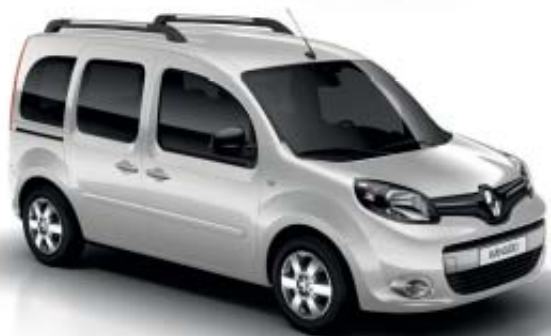
Branco Mineral (OQNG)