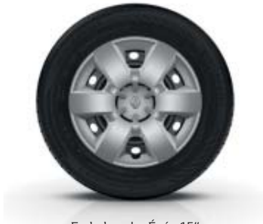
Embelezador Égée 15"