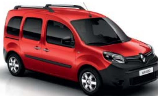
Vermelho Vivo (OV 719)*