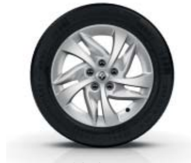
Jante de liga leve Egeus 16"