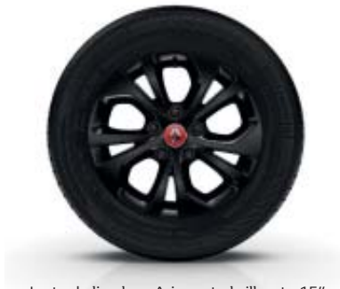
Jante de liga leve Aria preto brilhante 15"