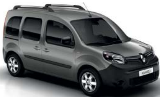
Cinzeno Taupe (OKNU)*