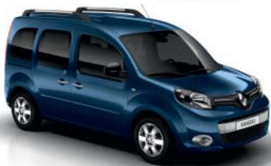
Azul Cosmos (TE RPR)