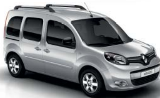
Cinzeno Silver (TE KNX)