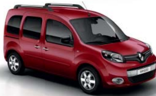
Vermelho Pavot (TE NNG)