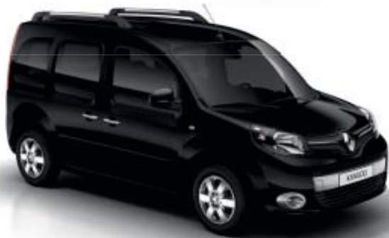
Preto Metalizado (TE GND)