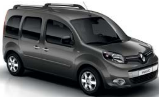
Cinzento Cassiopeia (TE KNG)