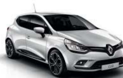
Cinzento Platina (TE)