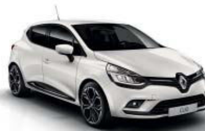
Branco Nacarado (TEE)