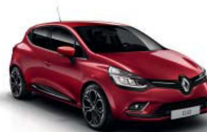
Vermelho Intense (TEE)