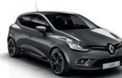
Cinzento Urban (OV) Apenas disponível para Clio Zen e Clio Limited

TE: pintura metalizada TEE: pintura metalizada especial OV: pintura opaca Fotos não contratuais