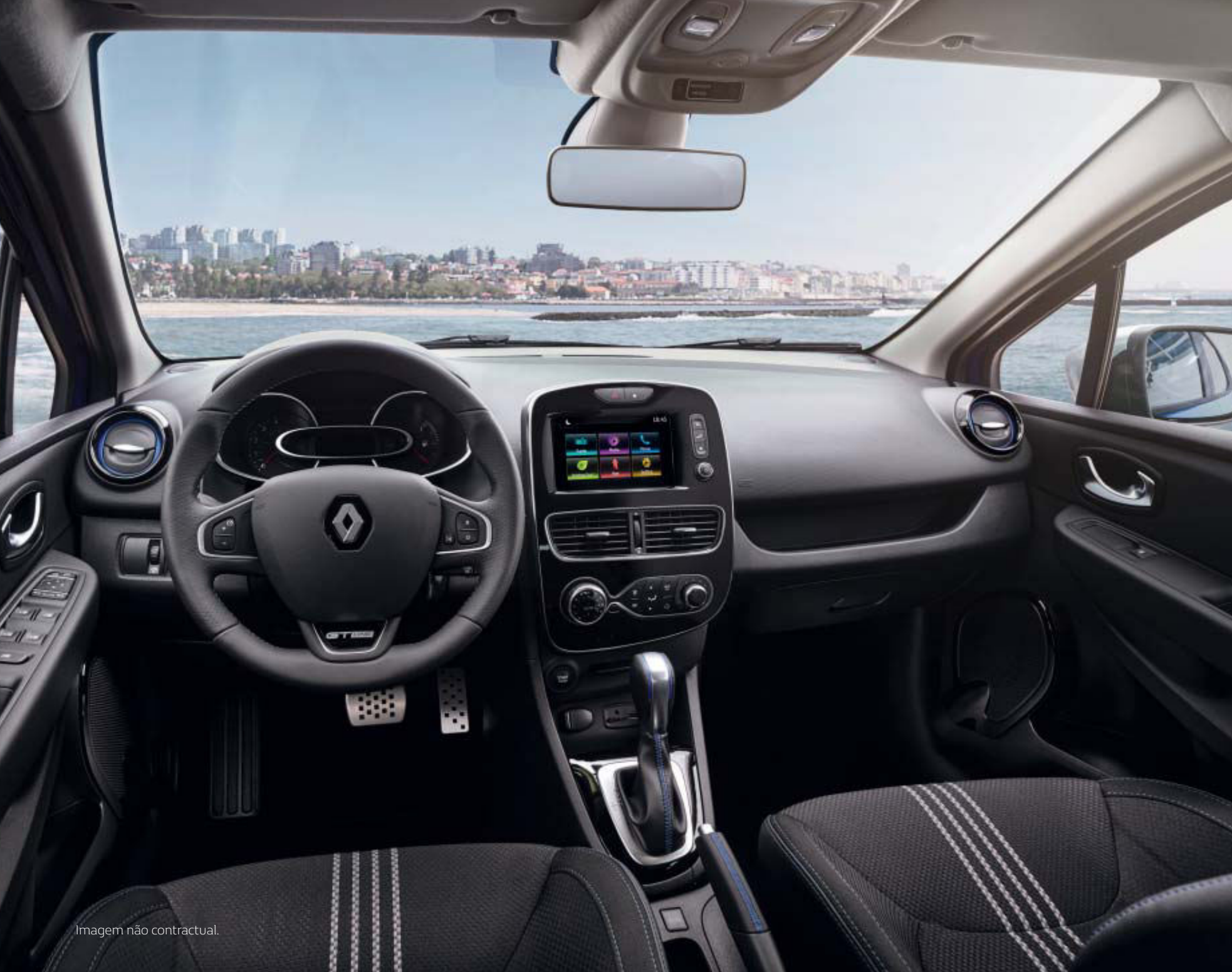
Imagem não contractual.