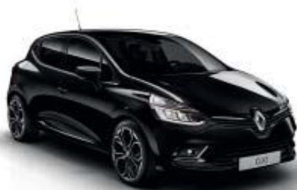
Preto Estrela (TE)