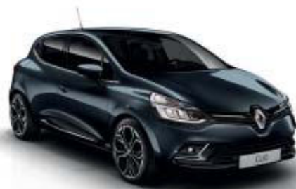
Cinzento Titanium (TE) Apenas disponível para Clio Zen e Clio Limited