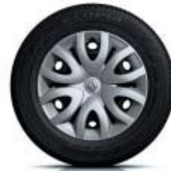
Embelezador de roda 15''