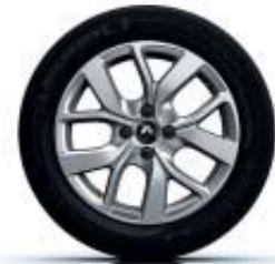
Jantes em liga leve de 16" Limited