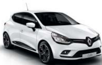
Branco Glaciar (OV)