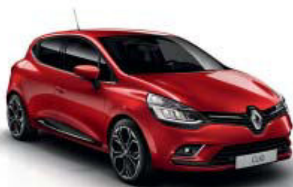
Vermelho Flamme (TEE)