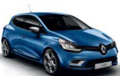
Azul Iron (TE) Apenas disponível para Clio GT Line