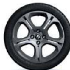
Jantes em liga leve de 16" GT Line